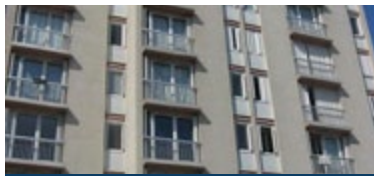
Avenue Victor Hugo