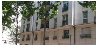
Rue Jacques Henri Lartigue