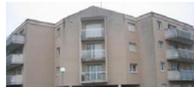
Chemin de Beauval