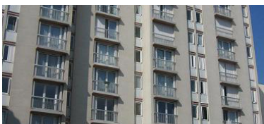
Avenue Victor Hugo