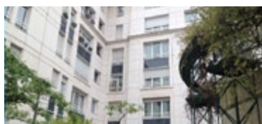
Avenue de la Cristallerie