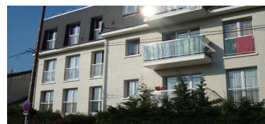
Rue Conrad Adenauer