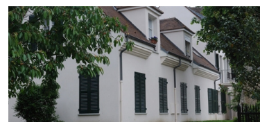
Rue Pierre Brossolette