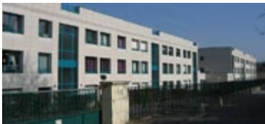
Rue Basse de la Terrasse