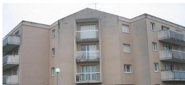
Allée des Pripris