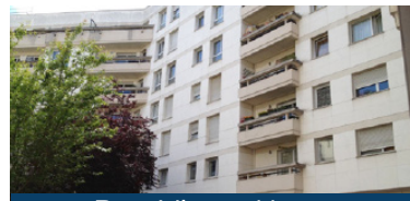
Rue Victor Hugo