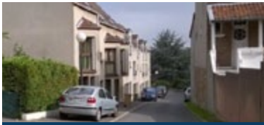
Allée des Pripri