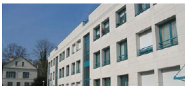
Rue Basse de la Terrasse