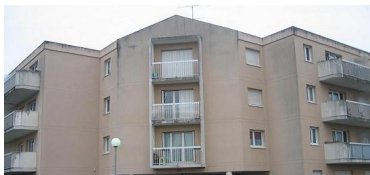
Chemin de Beauval