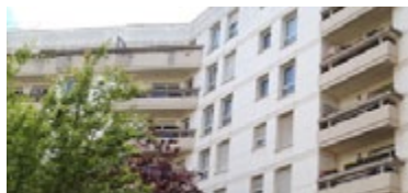
Rue Victor Hugo