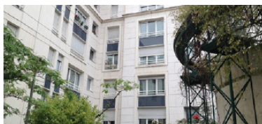
Avenue de la Cristallerie